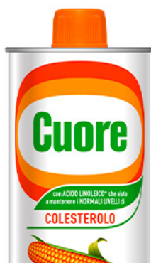
Olio di Mais