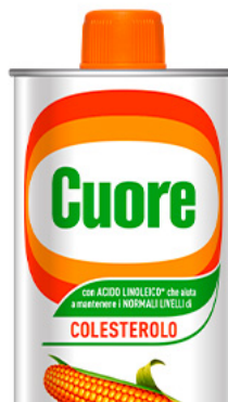
Olio di Mais